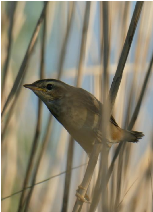
Rietzanger (Juv.)