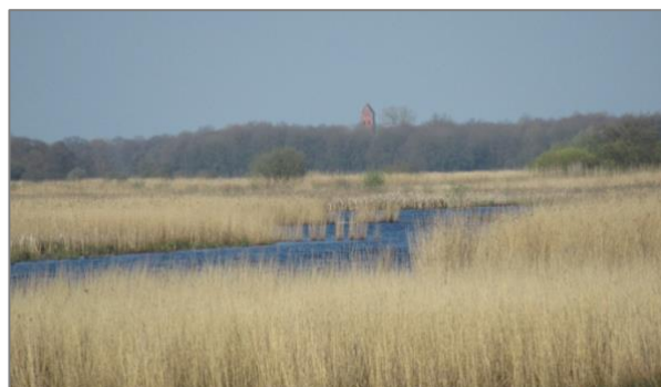
Links: weiland voor inrichting als natuur- en waterbergingsgebied. Afbeelding: Herinrichting Peize Rechts: moeras na inrichting als natuur- en waterberingsgebied.