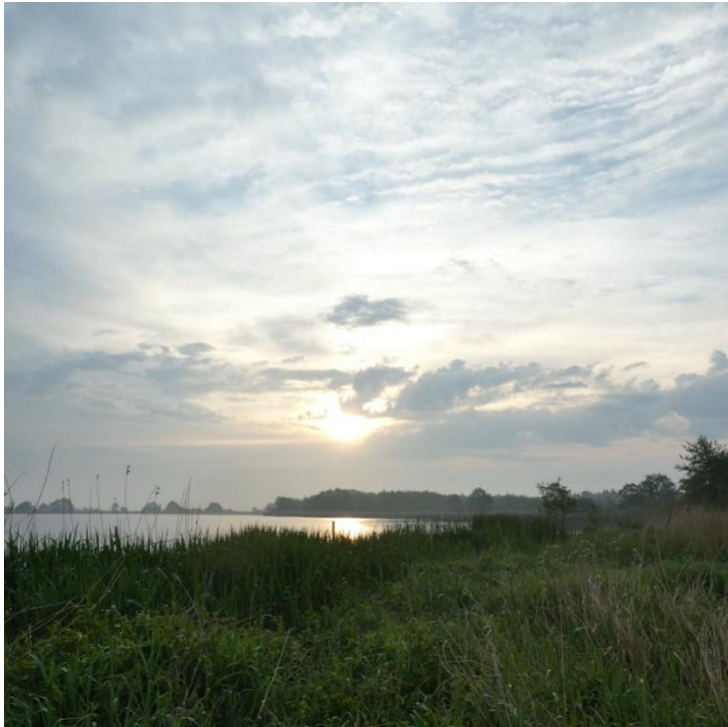
Telplot in de vroege ochtend.

Vanochtend kwart over vijf. Nog voor zonsopgang banen mijn dochter en ik ons een weg door mijn broedvogeltelgebied in een van de meest ontoegankelijke moerasgedeelten van De Onlanden. Het is telkens weer een uitdaging om mijn planken terug te vinden waarmee we de onzichtbaar geworden, maar daardoor extra verraderlijke sloten van het vroegere boerenland over kunnen steken, steeds dieper het moeras in. We tellen rietzangers, snorren, rietgorzen en een enkele blauwborst. De roerdomp die we al van verre hoorden hoempen vliegt met diepe vleugelslagen over ons heen. Dit is honderdprocents-natuur!