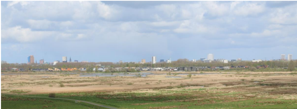
Weidse natuur vlak bij Groningen-Stad.

waarover de NOS-reportage sprak was gebaseerd op enkele lichtpuntjes. De terugkeer van de zeearenden, kraanvogels, otters en bevers en als lichtend voorbeeld van waar het goed gaat met de natuur werd specifiek verwezen naar De Onlanden. Goed nieuws om slecht nieuws te verbloemen.