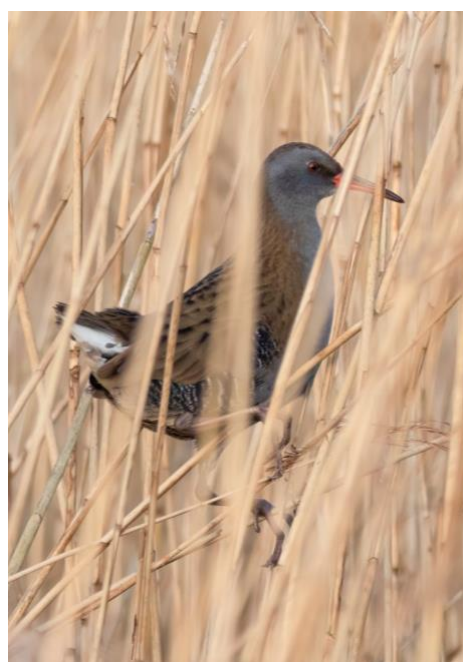
Waterral.